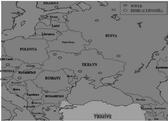
Şekil 1. Türkiye'nin etrafındaki nükleer santrallerin yerleri [7]

TAEK Ermenistan ve Bulgaristan'da bulunan Rus yapımı, VVER-440 tipi bu santrallerle ilgili inceleme başlatarak, her iki ülkenin sınırlarına monte edilen 32 istasyon aracılığıyla Radyasyon Erken uyarı ağı kurmuştur [6].